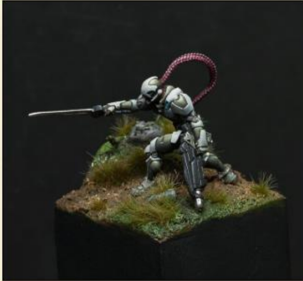
2) J'ai juste collé les pièces sur mon socle...