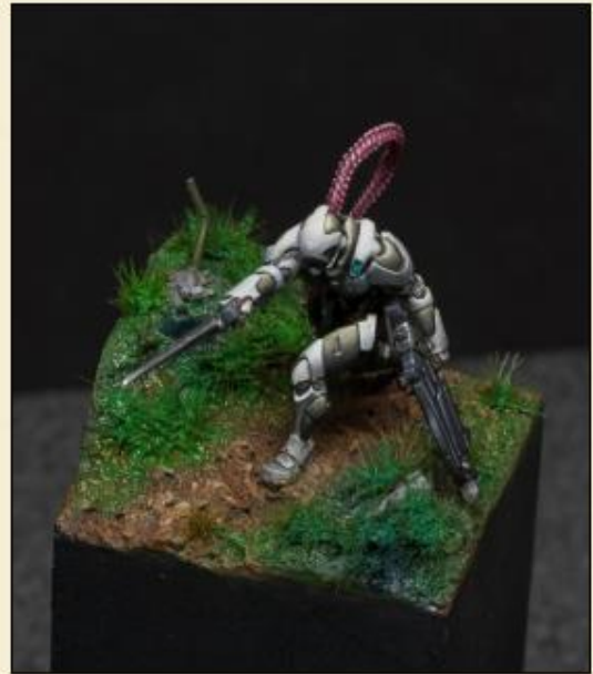
3) ... et les a peints