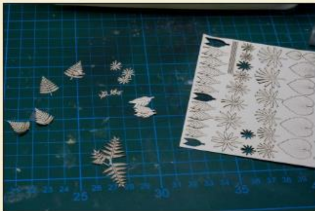
11) Découper les plantes en papier dans le papier. Pas la meilleure idée !