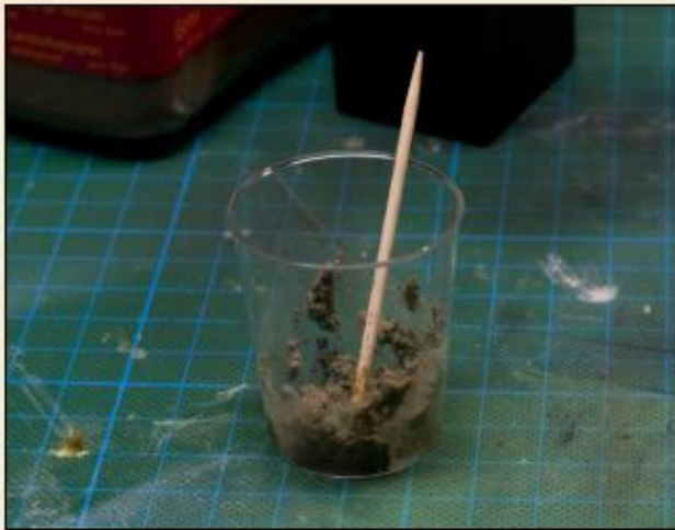
5) Mélangez-le et vous obtiendrez un matériau étrange