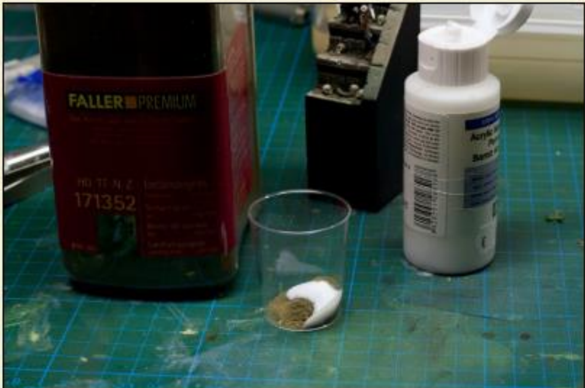
4) Mélangez la poudre avec du vernis mat