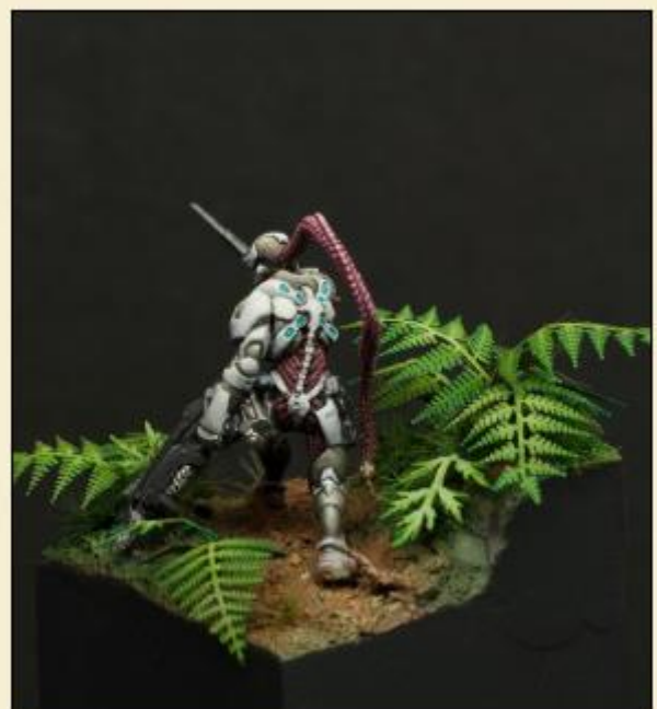
10) la base finie avec des pigments (par exemple les pieds)