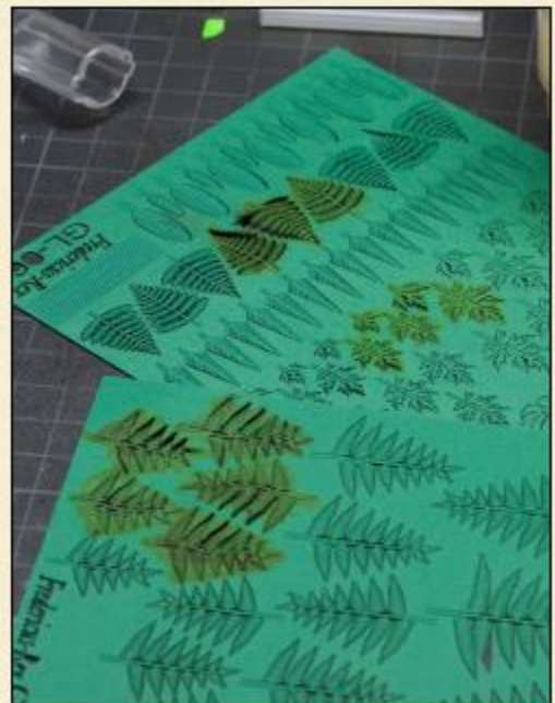
12) Beaucoup plus facile : peignez les plantes dans le papier