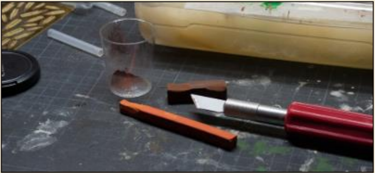
8) En mélangeant différentes couleurs, vous pouvez créer le ton parfait pour votre base

http://massivevoodoo.blogspot.de/2010/08/tutorial-working-with-colour-pigments.html