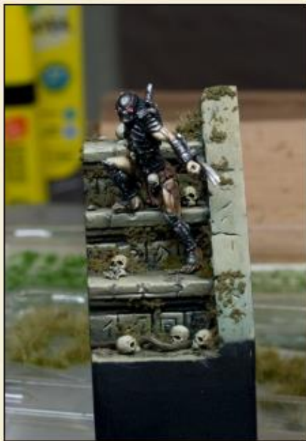
6) Fixez le matériau sur la base et laissez-le sécher