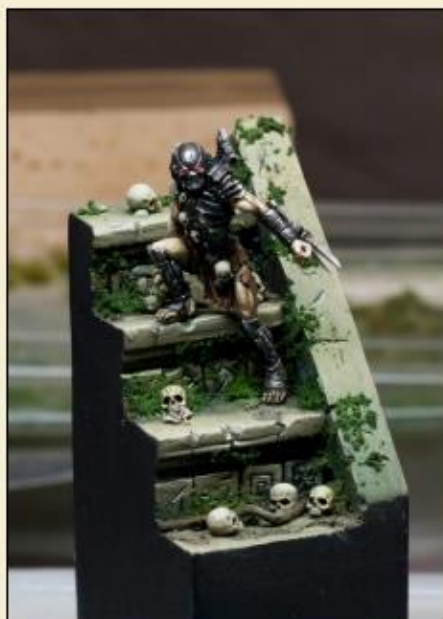
7) Peignez-le pour obtenir le meilleur effet