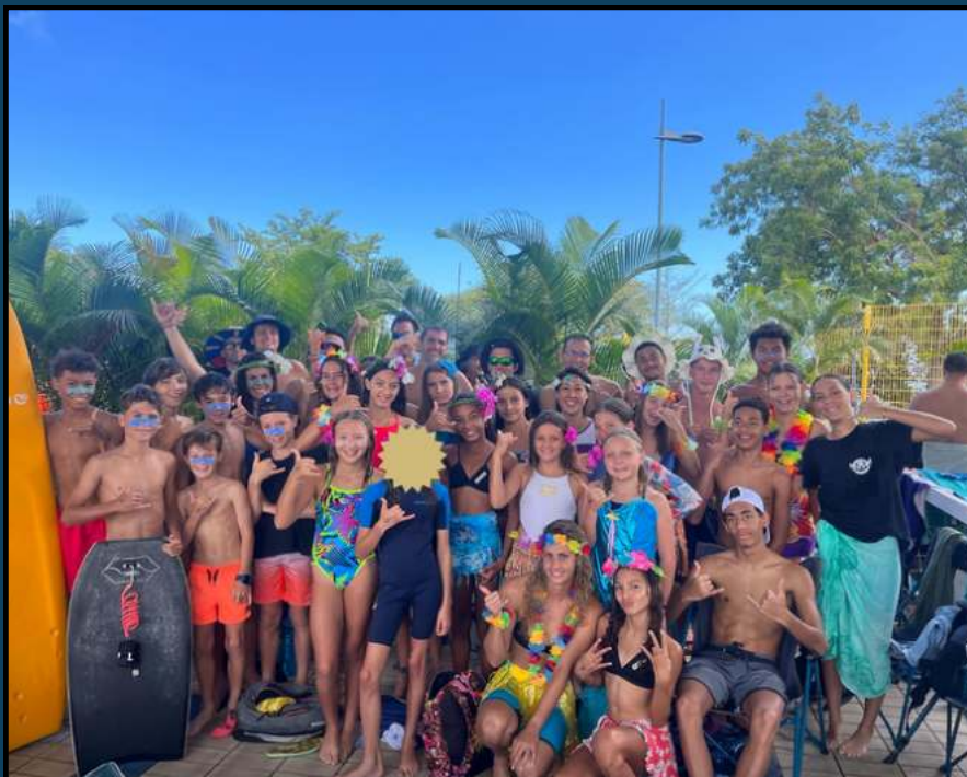
L'équipe des 40 compétiteurs pour les Interclubs 2024