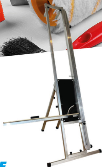
TABLE COUPE ITE STYROM «PREMIER»

Table spécialement conçue pour couper des matériaux isolants, tels que la laine de roche, laine de bois, laine de verre plaques en polyuréthane, panneaux en mousse de fibre de verre.