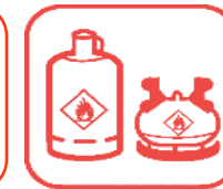
Bouteilles de gaz