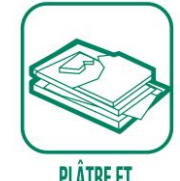
PLÂTRE ET PLAQUES DE PLÂTRE