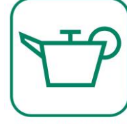
HUILES DE VIDANGE