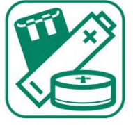
PILES ET ACCUMULATEURS