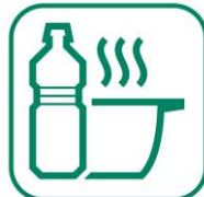
HUILES DE FRITURES