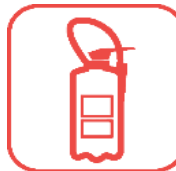
Extincteurs > 2kg