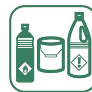
DÉCHETS DIFFUS SPECIFIQUES (DDS)