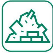
DÉBLAIS / GRAVATS