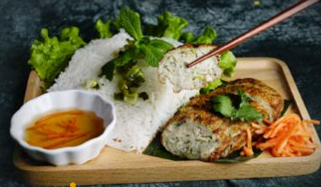
CHẢ CÁ 13.90€ Pâté de poisson parfumé à l'aneth accompagné de salade et cheveux d'ange Dill-flavored fish pie served with salad and angel hair