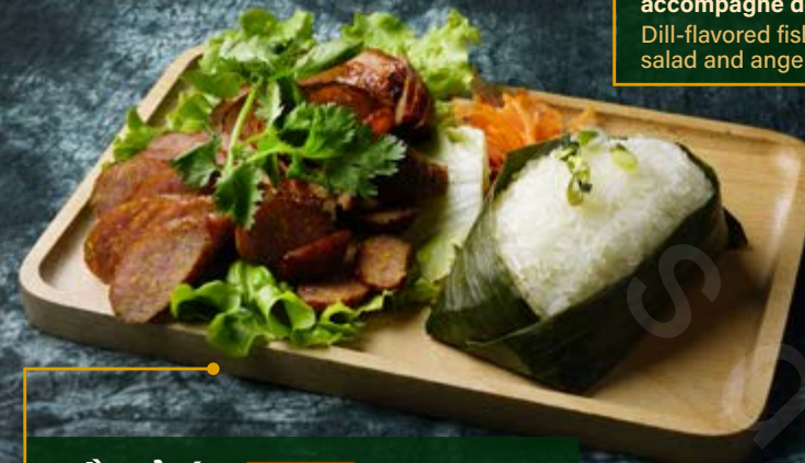
DỒI XẢ ỚT 12.90€ Saucisson chaud à la citronnelle avec riz gluant Lemongrass sausage with sticky rice