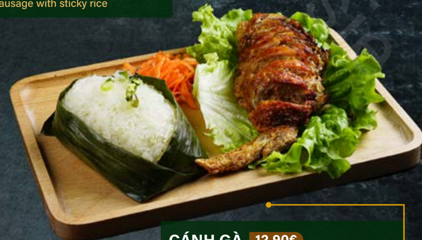
CÁNH GÀ 12.90€ Aile de poulet farcie à la viande avec riz gluant Stuffed chicken wing with sticky rice