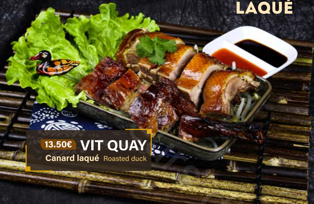
13.50€ VIT QUAY Canard laqué Roasted duck