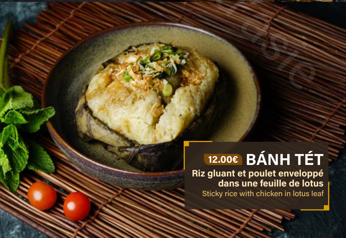
12.00€ BÁNH TÉT Riz gluant et poulet enveloppé dans une feuille de lotus Sticky rice with chicken in lotus leaf