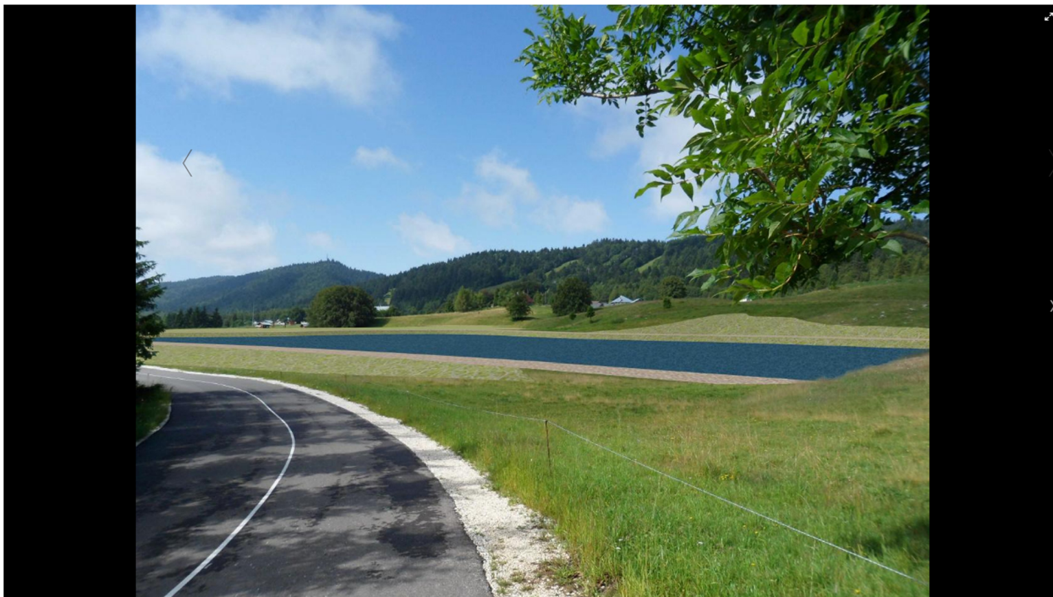
La réserve d'eau (en bleu sur la vue 3D) sera située à proximité du lieu-dit Côte Raget, dans la commune des Déserts, entre les pistes de ski rouies.

La création d'une retenue d'eau de 25 000 m3 est censée sécuriser l'enneigement de la station-village et proposer un cadre de pique-nique à la belle saison. Mais des associations environnementales estiment que c'est inutile au vu des changements climatiques.