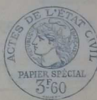
TABLE DECENNALE AC 95993 Des Actes de Naissances de la Commune de André de Ribac du 1er Janvier 1923 au 31 décembre (1923 à 1932)