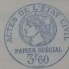
TABLE DECENNALE AC 95822 Des Actes de Naissances de Commune de Saint-André-de-Cubzac du 1 er Janvier 1923 au 31 décembre 1932. (1923 à 1932)