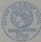
TABLE DECENNALE AA 56050 Des Actes de Naissances de la Commune de Landrie de Cibrac du 1 er Janvier 1923 au 31 décembre 1932. (1923 à 1932)