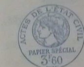
TABLE DECENNALE AC 95824 Des Actes de Naissances de Commune de Saint-André-de-Cubzac du 1 er Janvier 1923 au 31 décembre 1932. (1923 à 1932)