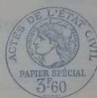
TABLE DECENNALE Des Actes de Naissances de la Commune de André de Cuba du 1er Janvier 1923 au 31 décembre 1932. (1923 à 1932)