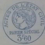
TABLE DECENNALE Des Actes de Naissances de la Commune de Saint-André-de-Cubzac du 1er Janvier 1923 au 31 décembre 1932. (1923 à 1932)